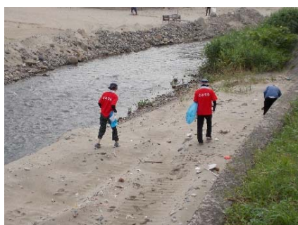
「とようら」Tシャツが目立ちます