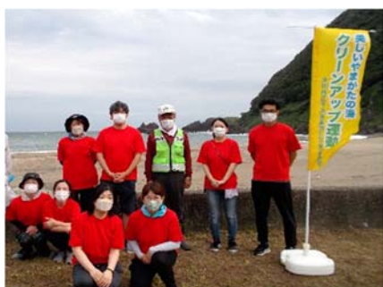
8名で参加してきました