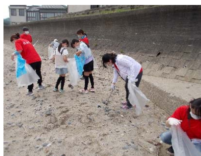
職員の子どもも一緒に参加