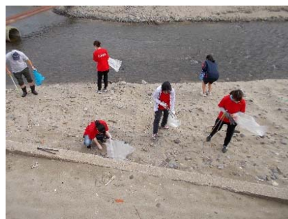
トングとゴミ袋を手に