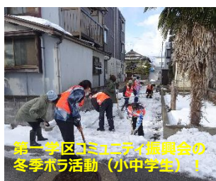
第一学区コミュニティ振興会の冬季ボラ活動（小中学生）！