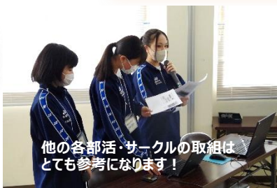
他の各部活・サークルの取組はとても参考になります!