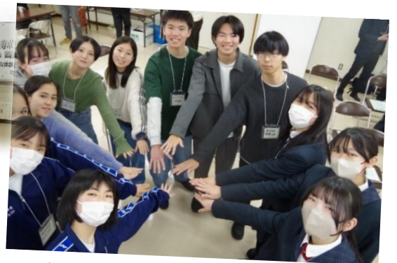
▲交流会で初めて会う人が多く、日頃の繋がりが大切だと感じた生徒たちでした