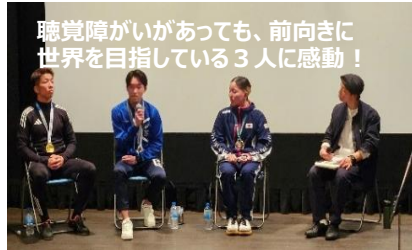
聴覚障がいがあっても、前向きに世界を目指している3人に感動！