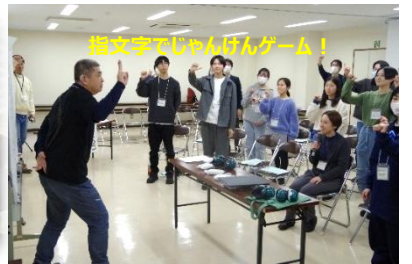
指文字でじゃんけんゲーム!