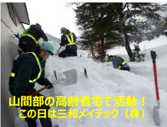
山間部の高齢者宅で活動！この日は三和メイテック（株）

雪が降ると、みんなが除排雪に追われてボランティアがすぐに駆けつけることは難しい現実。除雪ボランティアの相談があると、まずその地域の人たちでのお互いさまの助け合いを町内会長等をお願いします。近年、少しずつ町内会や学区・地区による仕組みや活動が増えてきました。日程を決めての除排雪は、特に山間部では企業や団体の皆さんが、市街地等では地域組織等が除雪ボランティア活動を行っています。ありがとうございます！